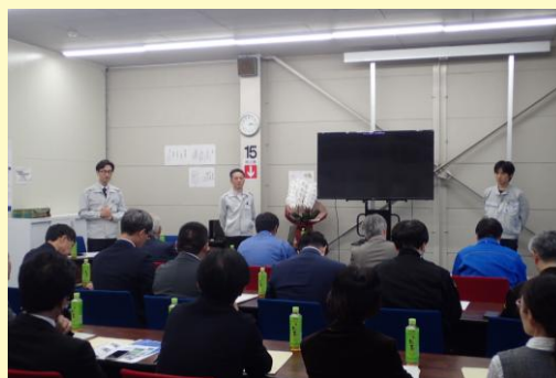
10月見学会(ワボウ電子株式会社養殖施設)