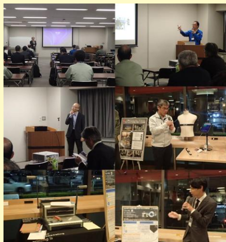
11月交流会(プレゼンテーションとポスター発表)