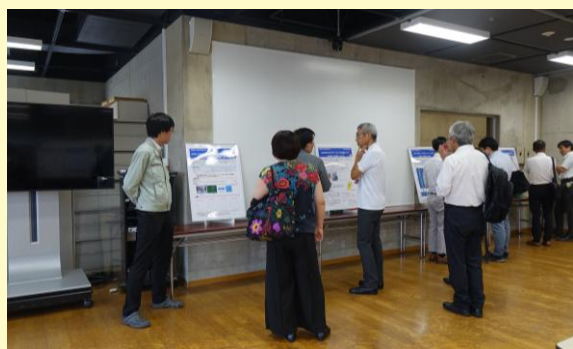
7月研究成果発表会(当センター職員との交流)