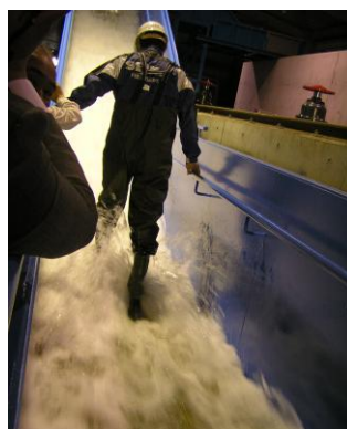
宇治川オープンラボラトリー 施設の見学・体験