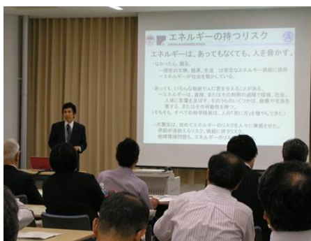
京大の先生の講演に聞き入る参加者