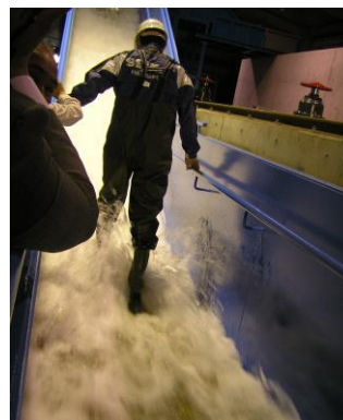
宇治川オープンラボラトリー 施設の見学・体験