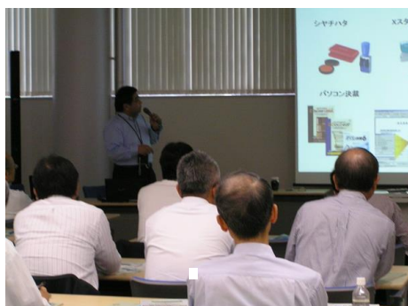
実際に連携によって何が生まれたか