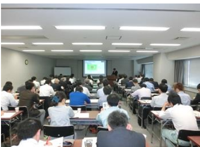
座学形式の例会 (web 併用以前の様子)