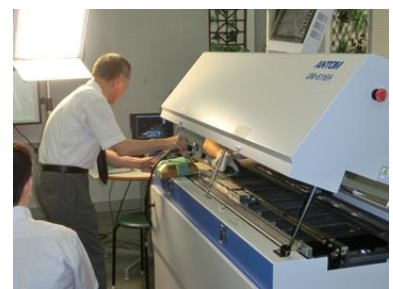
リフロー装置を使用した実験