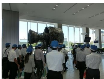
工場見学会 航空機エンジン