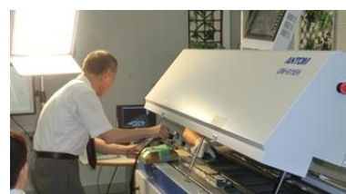
リフロー装置を使用した実験