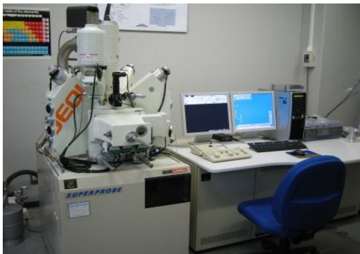
X線マイクロアナライザー