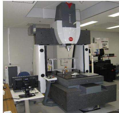
CNC 三次元座標測定機