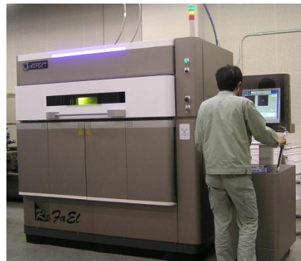
高速三次元成形機(3Dプリンター)