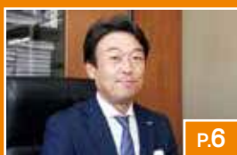
京都府元気印 認定企業のご紹介