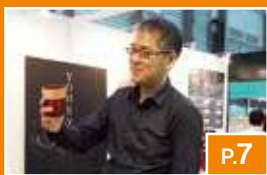
「Kyoto Japan」海外戦略 プロジェクト支援企業紹介