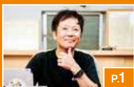
シリーズ「京の技」 「京都中小企業優秀技術賞」