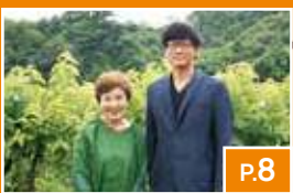
農商工連携の取り組み