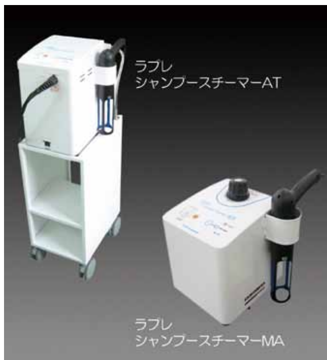
ラプレ シャンプースチーマー 約30センチ四方で6kgとコンパクト。ワゴン付きのポンプ自動給水タイプ(AT)には、軟水装置も付いている。

させることで一定量を水滴に戻し、髪に当たる時には通常の湯温と同程度の40℃にまで冷却されたスチームになるようにしました。もちろん「ナノ分子」も十分に残っていますので、潜熱の放出により地肌や毛髪の温度が早く上がり、シャンプーの洗浄能力も向上します。ヘアスチーマーと同様、水蒸気が髪の中にしっかり入り込むため、髪はしなやかになり、毛根の皮脂や汚れを浮かしてすっきりと洗えるのです。