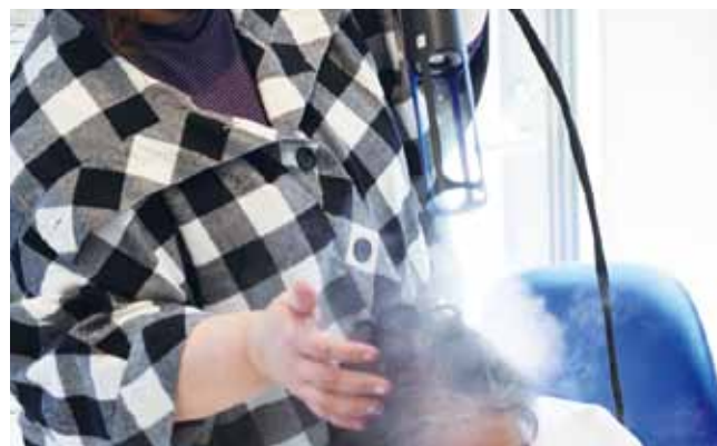
ラプレ シャンプースチーマー使用の様子

開発スタートから約4年間を経て、今ようやく、量産品の販売を始めました。当面は、訪問美容業者との連携により、独自ブランド「ラプレ シャンプースチーマー」として市場開拓していく予定です。