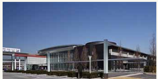
けいはんなオープンイノベーションセンター(KICK) オール京都で推進する「京都イノベーションベルト構想」の中核を担う産学連携拠点

来る6月23日(火)には、同大学エネルギー理工学研究所の皆さんとの交流会(講演、連携企業の紹介など)を開催します。交流会への参加、同連絡会についてのお問い合わせはけいはんな分室まで。会員以外の方の交流会参加も歓迎します。詳しい内容は京都府中小企業技術センターホームページをご覧ください。