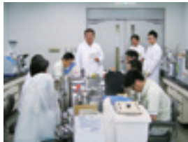
食品・バイオ研究室