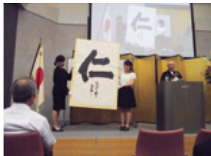
森貫主による揮毫

仏の教えについて、逸話を交えて解説されました。人間の心を開く＝「開帳」であり、その中は善悪入り交じっている。非常に複雑なものである。がしかし、これほど大切なものはなく、すべての事象には必ず「心」が存在する。一つの命が成り立つためには無量の支えとの「絆」と話されました。