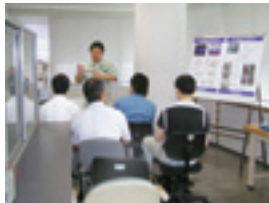
電子・情報技術研究室