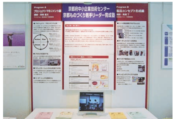
<成果をまとめ京都ビジネス交流フェアに出展>

受講後開発事業を担当する組織が編成され、現在は営業技術グループとして商品開発を検討しています。