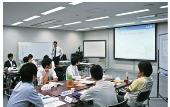
<グループで話し合い、コミュニケーションスキルを高める>