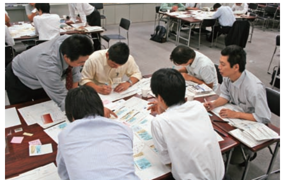
<グループで、開発アイデアをまとめ、リーダーとしてプレゼンテーションをする>